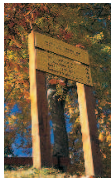
Une photo locale des sentiers ou balisage

Durée de la randonnée : La durée de chaque circuit est donnée à titre indicatif. Elle tient compte de la longueur de la randonnée, des dénivelées et des éventuelles difficultés.