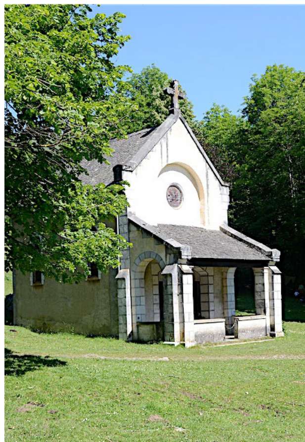
La chapelle du Houndas.

1h05 5 706273 E - 4770253 N Traverser et continuer en face. Le chemin passe entre des clôtures. Laisser un départ de piste sur la droite et continuer par le chemin bordé de noisetiers qui aboutit sur une route. Prendre à gauche, passer la barrière et continuer à descendre jusqu'à la chapelle.